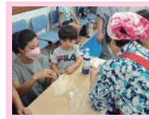
（子ども体験型イベント）